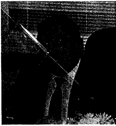
“กระทรวงนี้... ประชาชนสัมผัสได้ และต้องได้” พลเอกชวลิต ยงใจยุทธ 25 กันยายน 2536