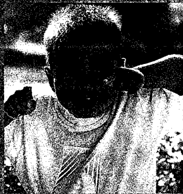
คัสเน่า 4 ขวบ

สภามหาวิทยาลัยสงขลานครินทร์ ดำเนินการพิมพ์ครั้งที่ 2000