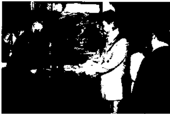
นายอิระวดีร์ จันทรประเสริฐ ปลัดกระทรวงแรงงานและสวัสดิการสังคม ประธานมอบเงินทุนประกอบอาชีพ ให้กับตัวแทนกลุ่มของชุมชนในเขตพื้นที่ดินแดง ณ ศูนย์ชุมชนเขตดินแดง