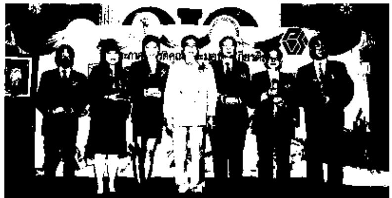
นายอิระวดีร์ จันทรประเสริฐ ปลัดกระทรวงแรงงานและสวัสดิการสังคม ประธานพิธีมอบโล่ประกาศเกียรติคุณโรงงานดีเด่น ปี 2004 เพื่อส่งเสริมสนับสนุนให้ผู้ประกอบการและผู้ใช้แรงงาน ได้ตระหนักถึงการทำงานร่วมกันที่จะยกระดับมาตรฐานของการประกอบกิจการให้ก้าวหน้าสู่มาตรฐานสากล ณ โรงรถรถยนต์เทศบาลนครสุพรรณบุรี