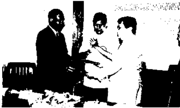
นายกรัฐมนตรี พิศาลบุตร และรัฐมนตรีว่าการกระทรวงสาธารณสุข ร่วมเป็นสักขีพยานในพิธีลงนามบันทึกข้อตกลงว่าด้วยความร่วมมือในการเพิ่มขีดความสามารถของแรงงานบริการสุขภาพ ระหว่าง นายอิระวดีร์ จันทรประเสริฐ ปลัดกระทรวงแรงงานและสวัสดิการสังคม กับ น.พ.มงคล ณ สงขลา ปลัดกระทรวงสาธารณสุข ณ กระทรวงสาธารณสุข