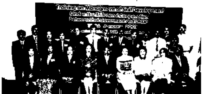
นายอิระวดีร์ จันทรประเสริฐ รองปลัดกระทรวงแรงงานและสวัสดิการสังคม ประธานพิธีเปิดการฝึกอบรมพัฒนาบุคลากรภายใต้แผนงานความร่วมมือไตรภาคีระหว่างรัฐบาลไทยและ UNDP เรื่อง Training on Management of skill Development ให้กับผู้บริหารจากประเทศต่างๆ ในภูมิภาคเอเชีย จำนวน 13 ประเทศ ณ ห้องประชุมกรมพัฒนาฝีมือแรงงาน