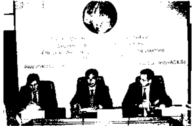
นายอิระวดีร์ จันทรประเสริฐ ปลัดกระทรวงแรงงานและสวัสดิการสังคม ประธานเปิดการประชุมระดับภูมิภาคระหว่างเจ้าหน้าที่ของประเทศที่ส่งแรงงานไปทำงานต่างประเทศในแถบเอเชีย 8 ประเทศ เข้าร่วมประชุมเพื่อแลกเปลี่ยนความคิดเห็นและกำหนดแผนงาน โอบายชร์ร่วมกันในการแก้ปัญหาการส่งแรงงานไปทำงานต่างประเทศ ณ ห้องประชุมสำนักงานปลัดกระทรวงแรงงาน