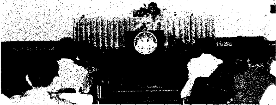
ภาพประกอบ : โครงการสัมมนากำนันผู้ใหญ่บ้าน เพื่อการพัฒนาฝีมือแรงงาน วันที่ 8 กุมภาพันธ์ 2538 ณ สถาบันพัฒนาฝีมือแรงงาน ภาคตะวันออกเฉียงเหนือตอนล่าง อุบลราชธานี