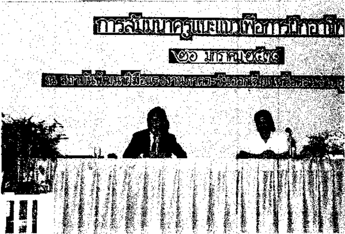
ภาพประกอบ : โครงการสัมมนาครูแนะแนว เพื่อการพัฒนาผู้มีมือแรงงาน วันที่ 26 มกราคม 2538 ณ สถาบันพัฒนาผู้มีมือแรงงาน ภาคตะวันออกเฉียงเหนือตอนล่าง อุบลราชธานี