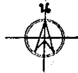
แผนที่จังหวัดแพร่