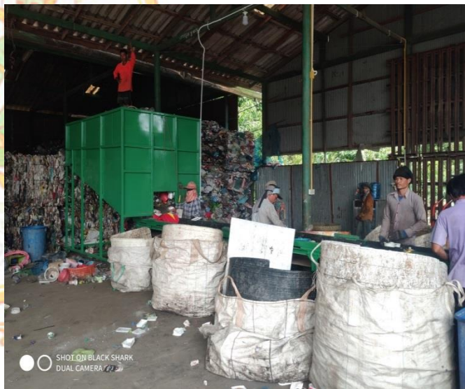
การตรวจบูรณาการสถานประกอบกิจการกลุ่มเสี่ยง จังหวัดพระนครศรีอยุธยา ประจำปีงบประมาณ พ.ศ. ๒๕๖๑ โดยหน่วยงานสังกัดกระทรวงแรงงานจังหวัดพระนครศรีอยุธยา ร่วมกับ สำนักงานตรวจคนเข้าเมืองจังหวัดพระนครศรีอยุธยา และสำนักงานพัฒนาสังคมและความมั่นคงของมนุษย์จังหวัดพระนครศรีอยุธยา จำนวน ๔๐ แห่ง