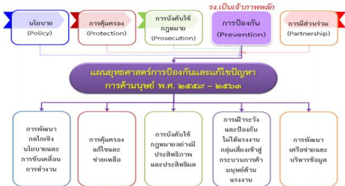
ภาพที่ ๒ : แสดงกรอบแนวคิดยุทธศาสตร์การป้องกันและแก้ไขปัญหาการค้ามนุษย์ด้านแรงงาน