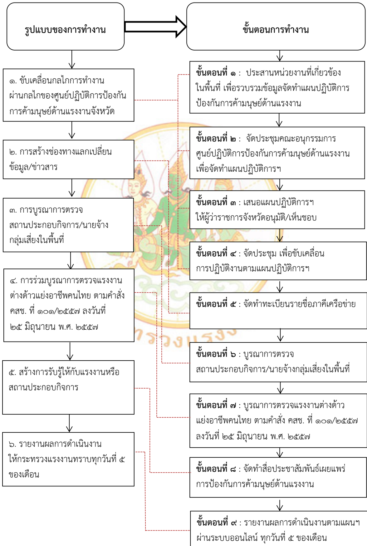
ภาพที่ ๓ : แสดงขั้นตอนการดำเนินการและรูปแบบการทำงานโครงการป้องกันปัญหาการค้ำมนุษย์ ด้านแรงงาน จังหวัดพระนครศรีอยุธยา